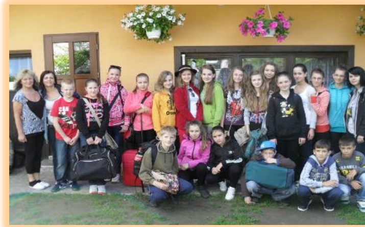
A takáto sme boli partia v Červenom Kláštore!